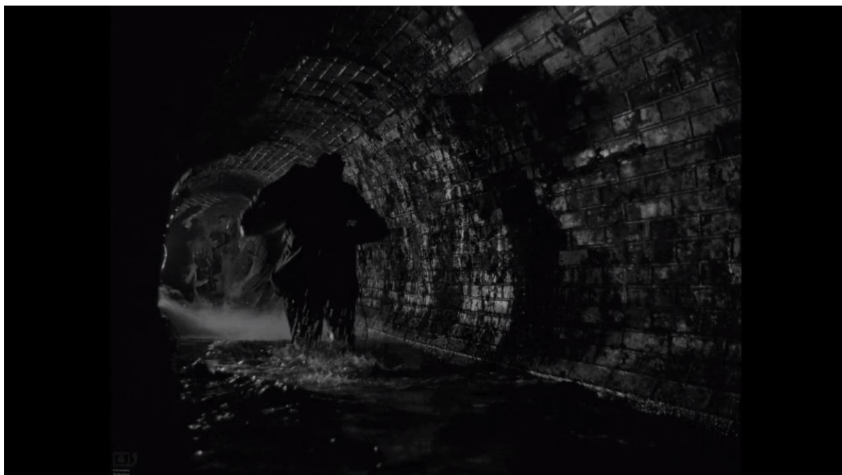
Kadr z filmu „Kanał”, reż. Andrzej Wajda, 1956