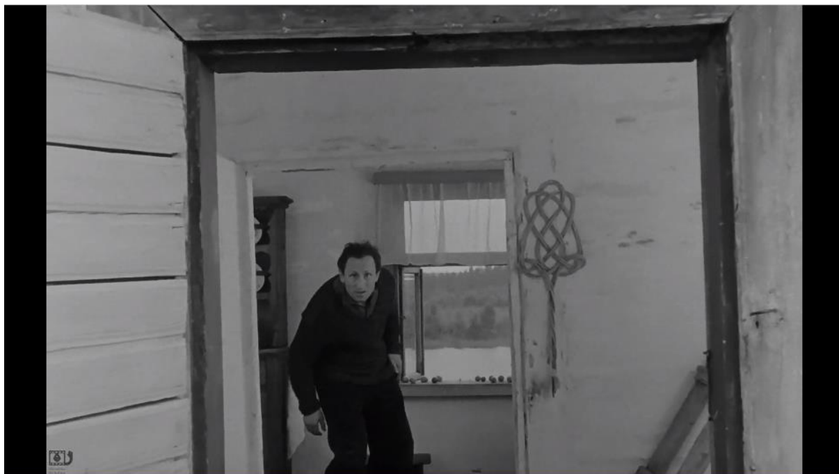
Kadr z filmu „Żywot Mateusza”, reż. Witold Leszczyński, 1967