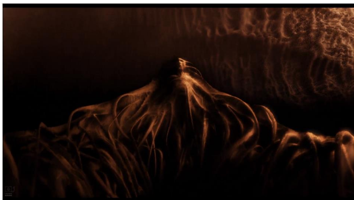
Kadr z filmu „Katedra”, reż. Tomasz Bagiński, 2002