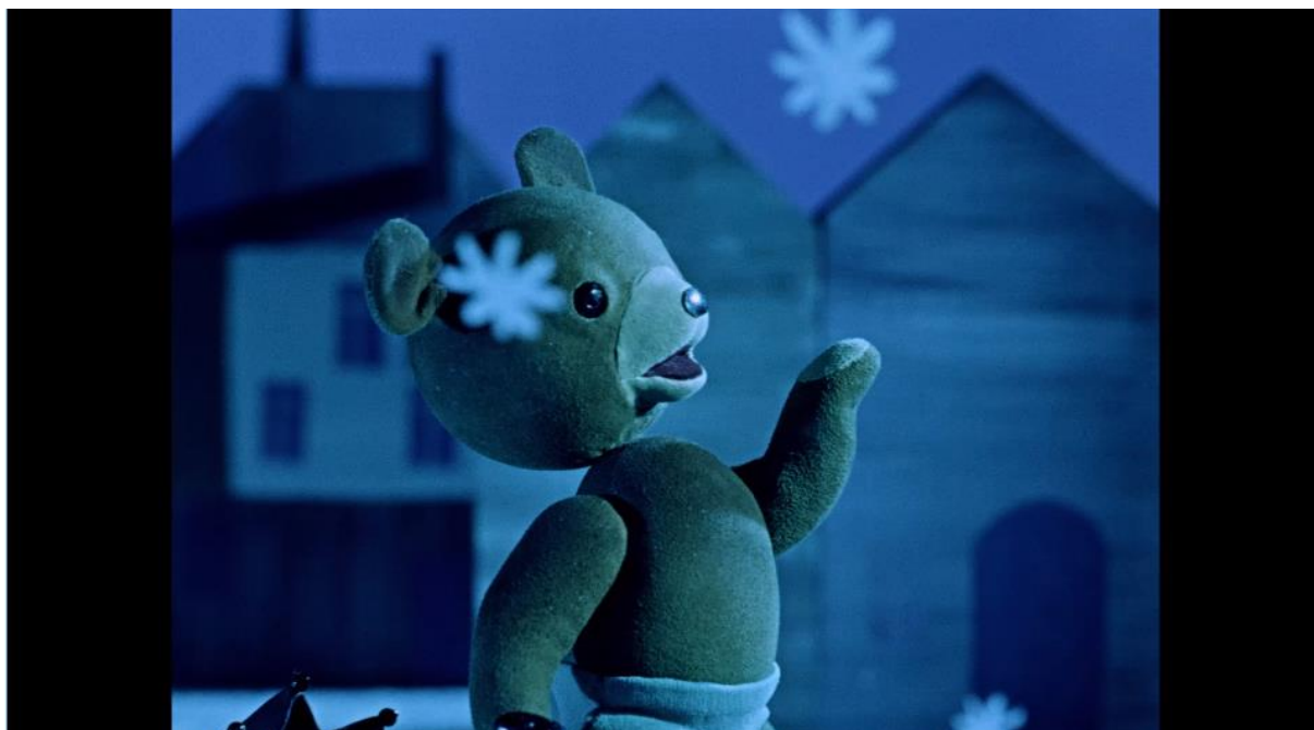
Kadr z filmu „Miś Uszatek”, reż. Lucjan Dembiński, 1975