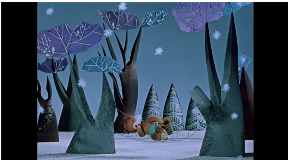
Kadr z filmu „Miś Uszatek”, reż. Lucjan Dembiński, 1975