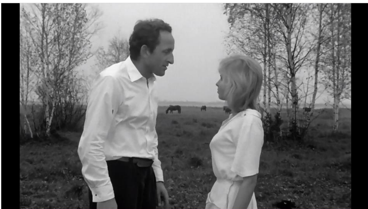
Kadr z filmu „Żywot Mateusza”, reż. Witold Leszczyński, 1967