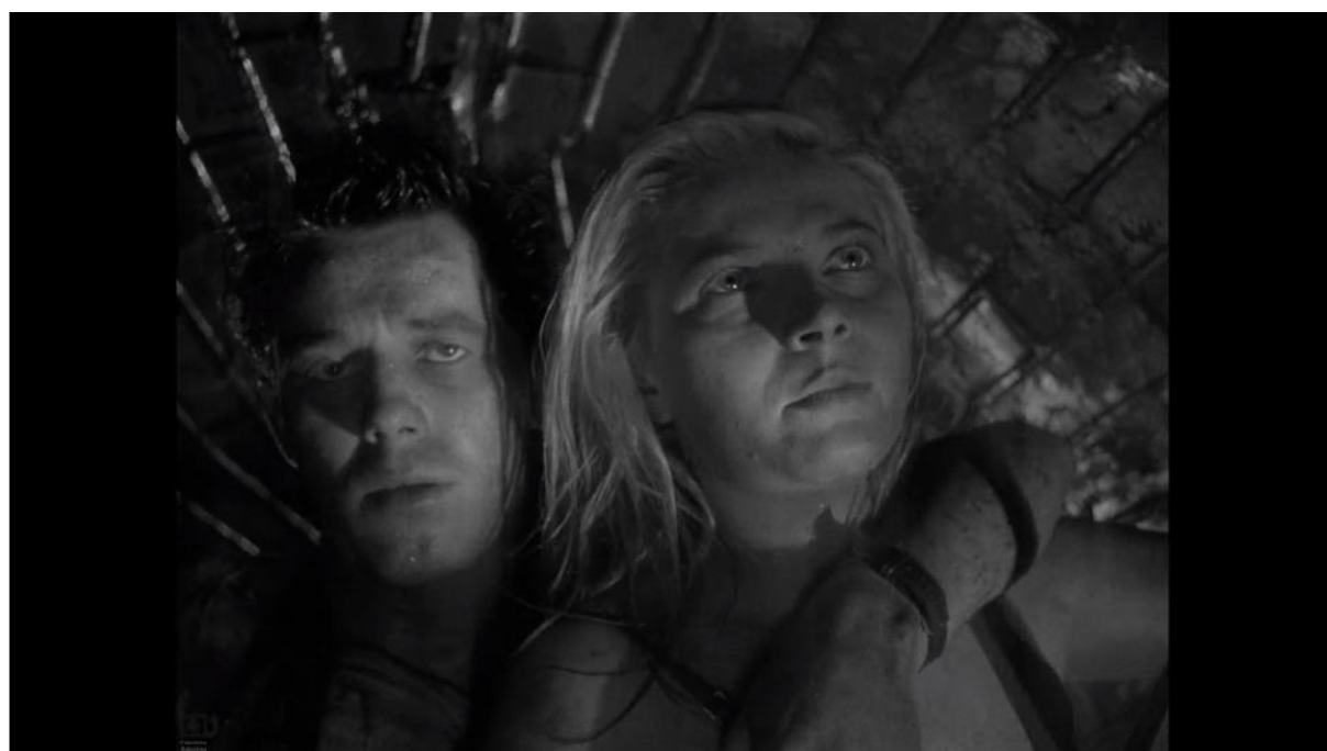
Kadr z filmu „Kanał”, reż. Andrzej Wajda, 1956