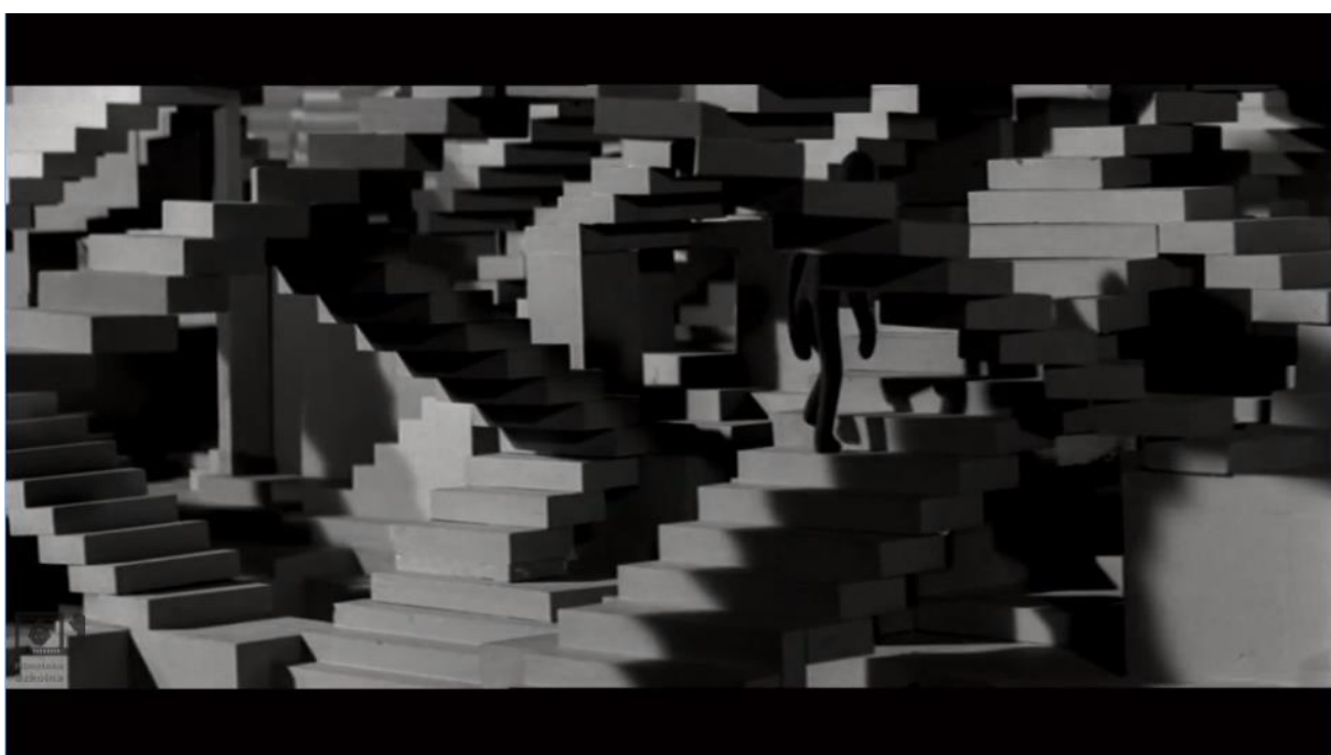
Kadr z filmu „Schody”, reż. Stefan Schabenbeck, 1968